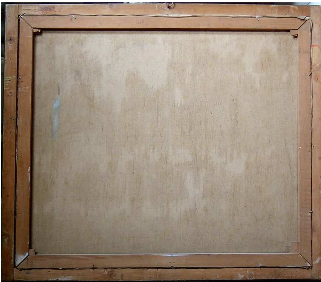
A kép állapota restaurálás előtt (átvételi állapot)