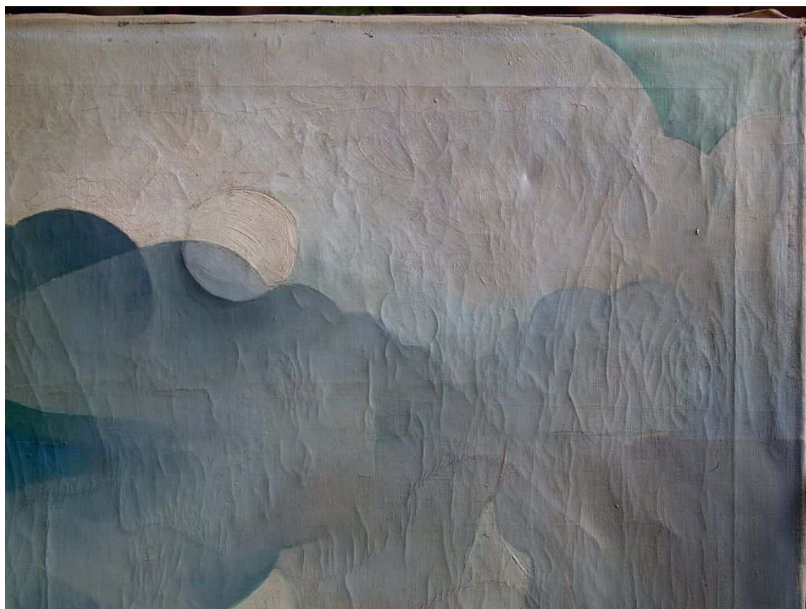
A kép részletei jellegzetes elváltozásokkal: sárgult, egyenetlen lakk, repedések, kagylósodás