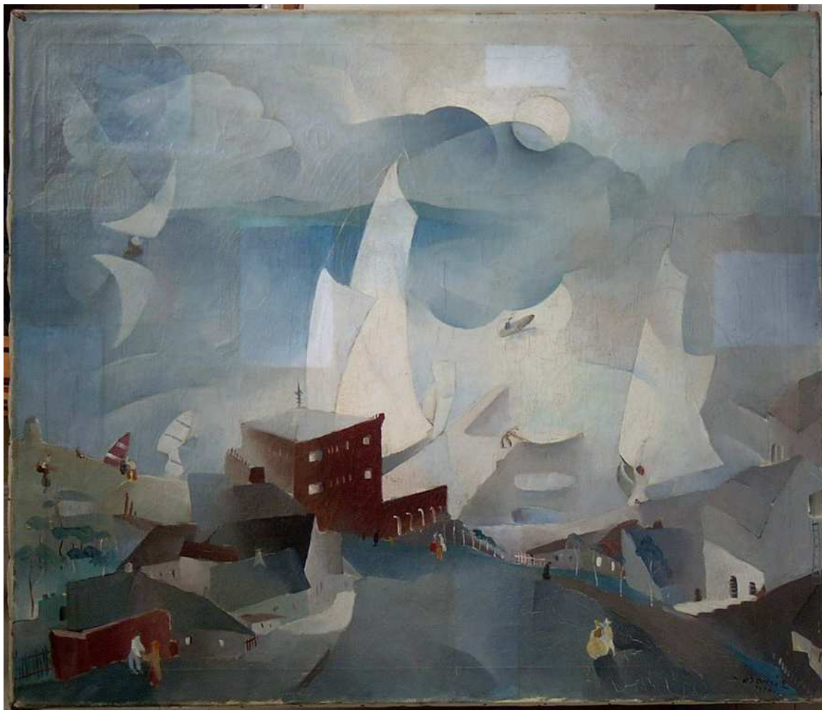
Lakkoldó próbák a festett felületen