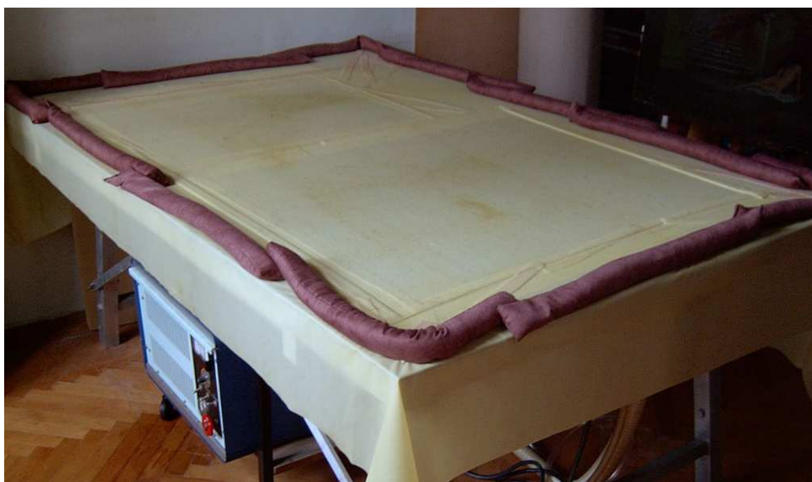
A vászon és a húzószélek előkészítése – konzerválás fűthető vákumasztalon