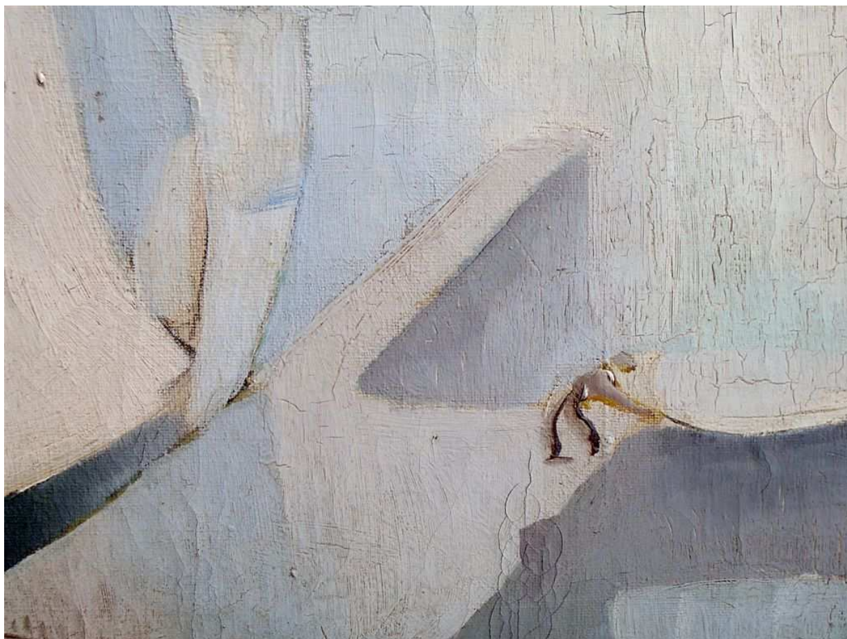
Retusálásra nem szoruló festői jellegzetesség – kilátszó alapozás és ceruza előrajz