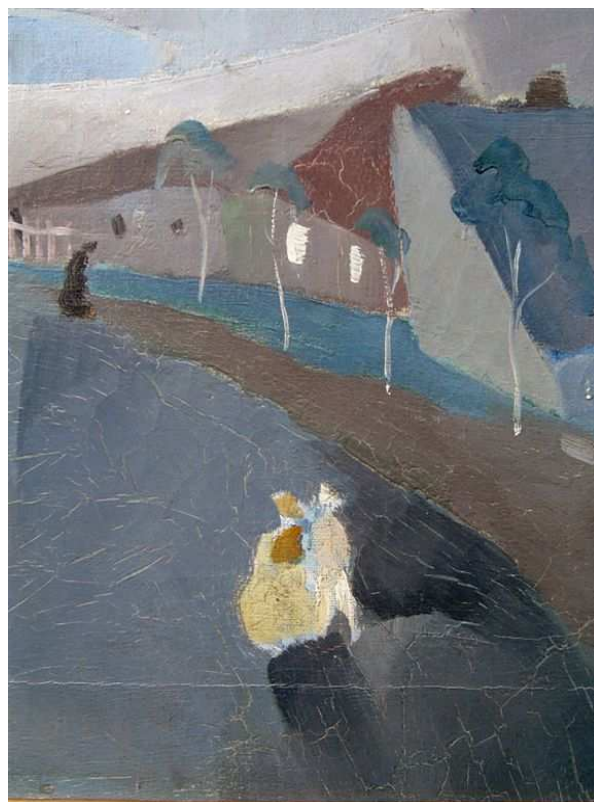
Két kis alak – a restaurálás előtt és után, kevés összefogó retussal a repedésekben