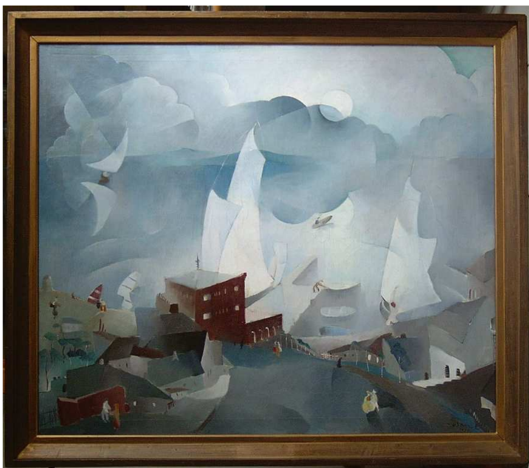
Az új, sarokékelésű keresztmerezítős vakkeretre feszített kép restaurálás után