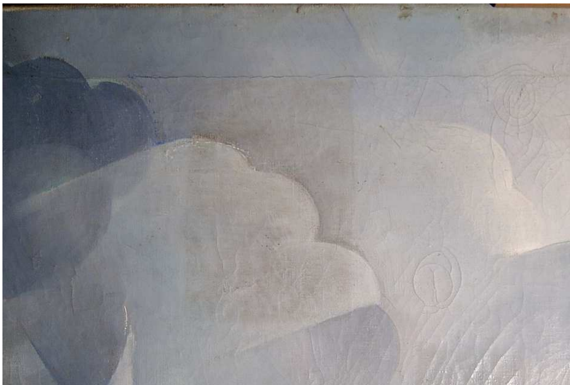
A lakk leoldása után még további tisztításra volt szükség