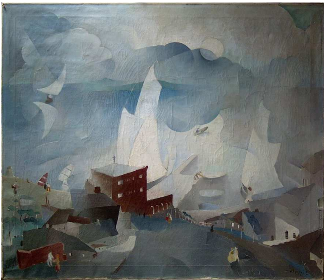
A keretéből kivett kép felszíne normál és enyhe súrló fényben restaurálás előtt