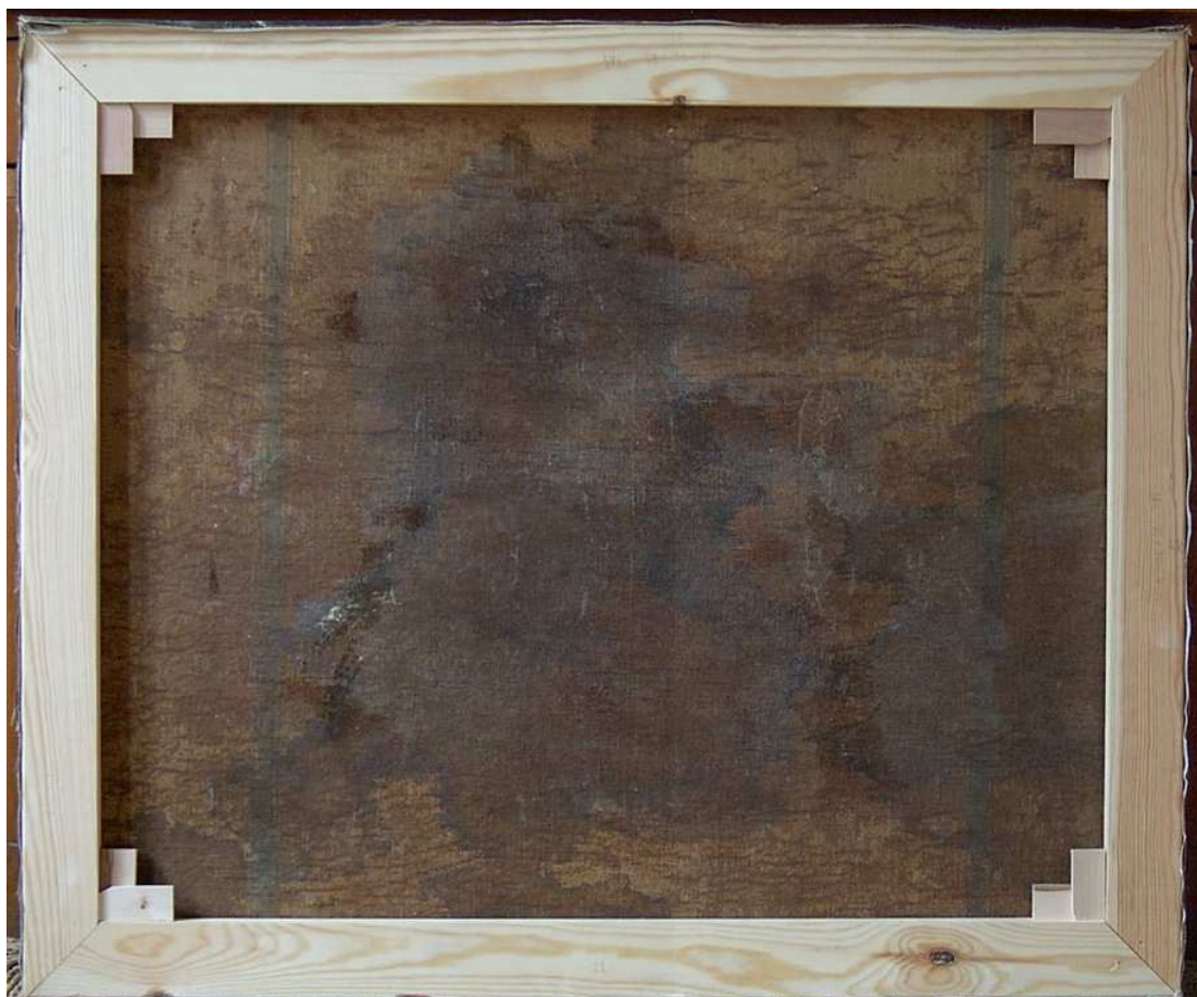
A konzervált, új keretre feszített kép hátoldala és a kitömített képfelzín