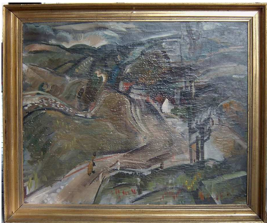
A kép állapota restaurálás előtt (átvételi állapot)