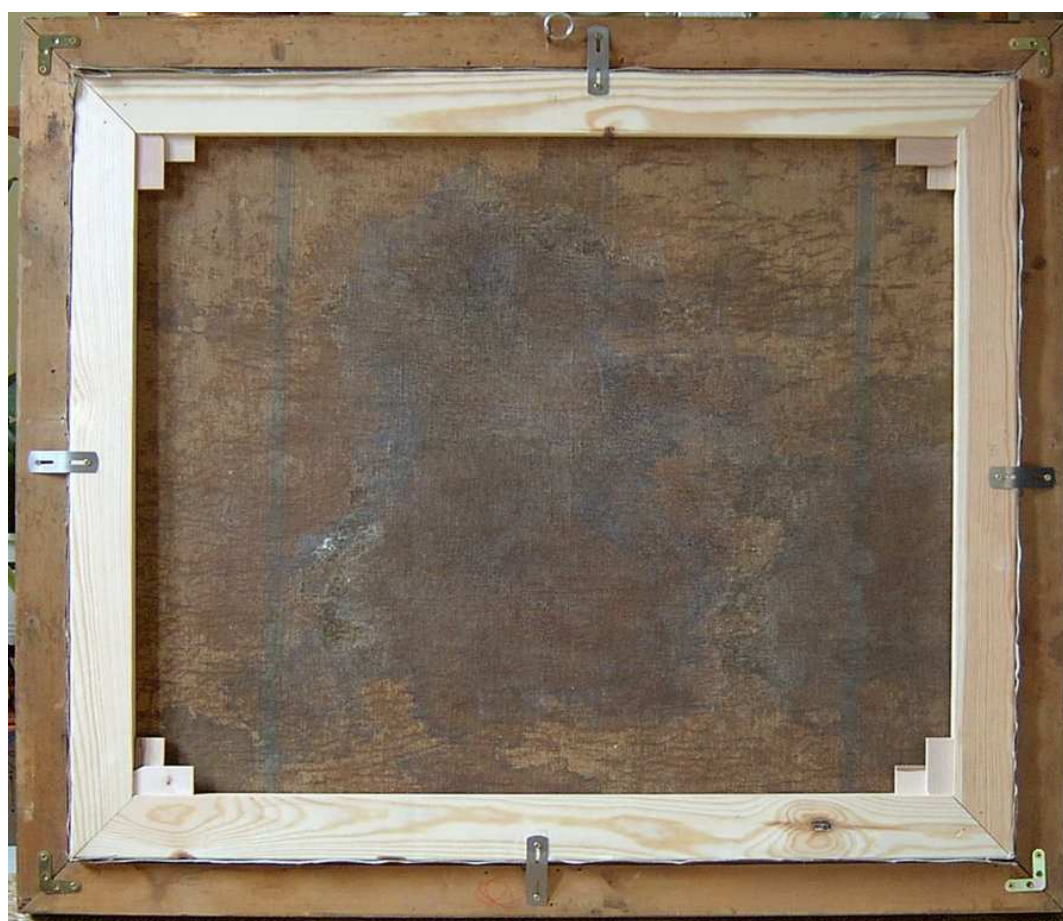
A megerősített díszkeretébe visszatett, restaurált festmény 2015. 1. 23.