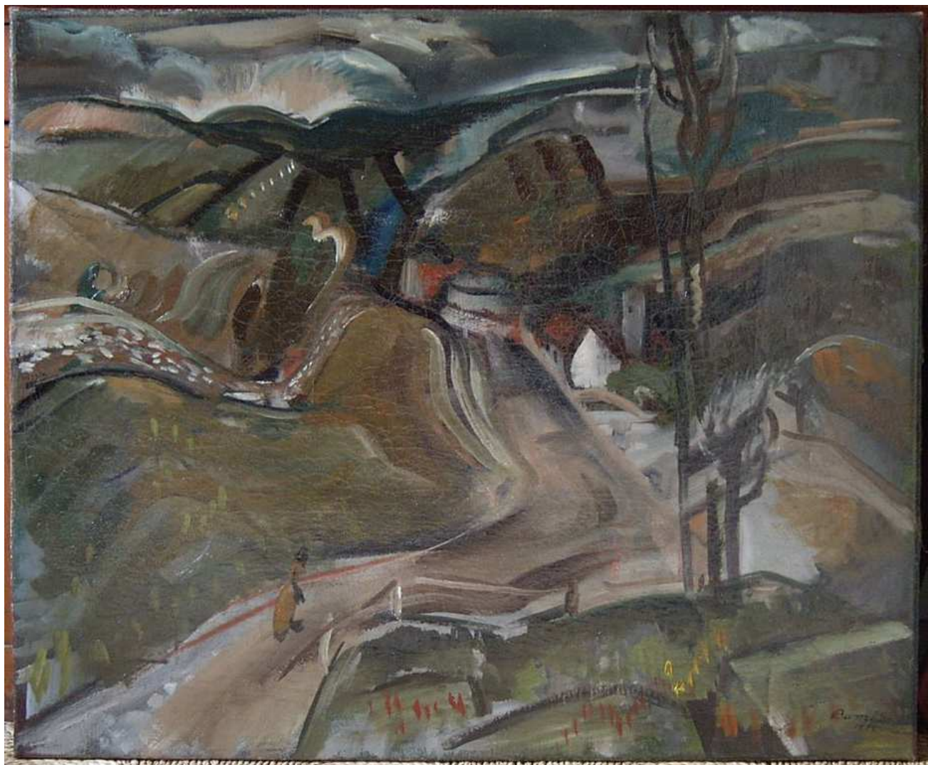
A festmény retusálás után