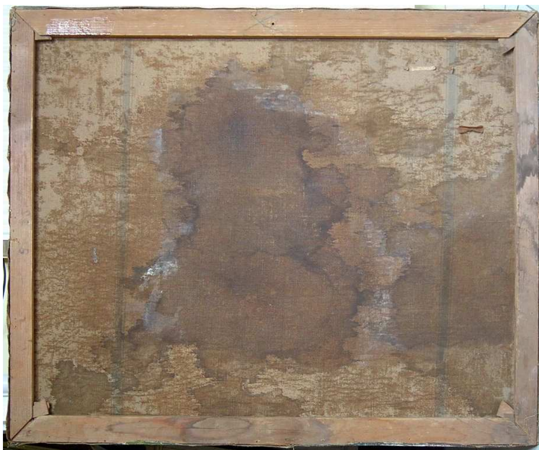
A díszkeretből kivett festmény állapota restaurálás előtt – a hátoldalon beázás nyoma