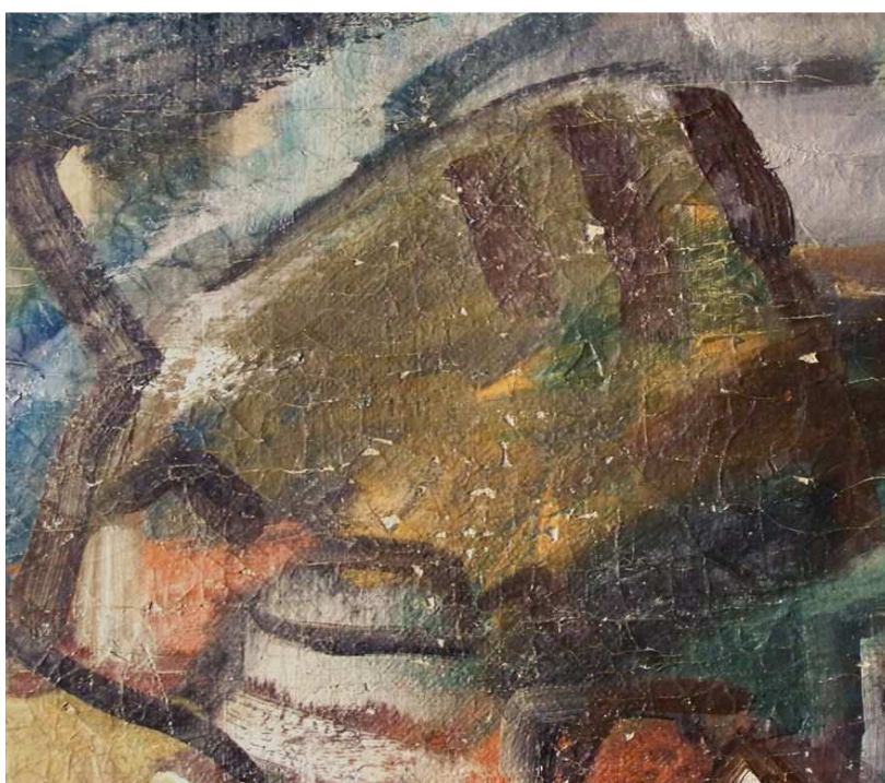
Felcserepedett képrészlet a szélek rögzítése előtt és után