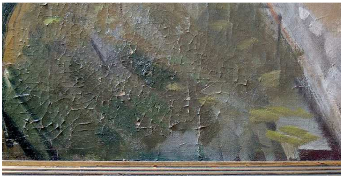
A képfelzár több helyen cserepes a beázás miatt