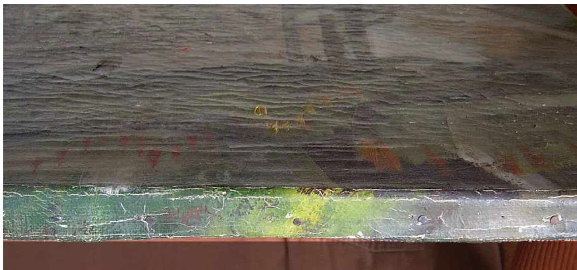
Másodlagosan festett vászon – a korábbi festés látszik a húzószélen