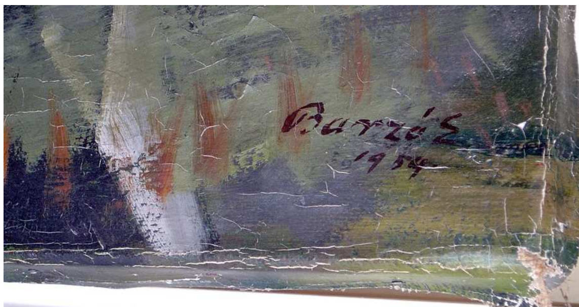
Jelzés jobbra lent: Barzó E 1954